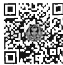
กระทู้ถามสด ด้วยวาจา