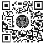
หนังสือนัดประชุม และระเบียบวาระการประชุม สภาผู้แทนราษฎร

สมาชิกสภาผู้แทนราษฎรสามารถอ่านและดาวน์โหลดเอกสารประกอบการพิจารณาได้ โดยการสแกน QR Code หรือทาง www.parliament.go.th